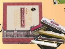
東京:東京駅丸の内駅舎最中