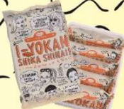
愛媛:い〜よかんしかしない