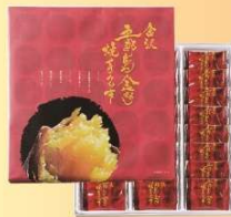
金沢:五郎島焼芋クッキー