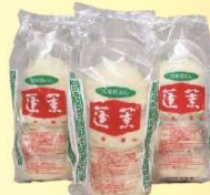
大阪:蓬萊本館豚まんセット