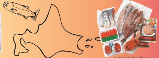
北海道:道産丸詰合わせ